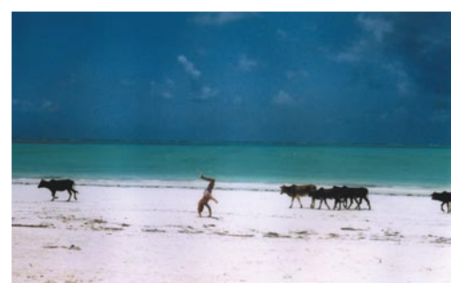
3° Africa - Gabriella Guarnieri